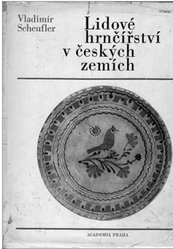
Мал. 5 Обкладинка книги Владіміра Шойфлера « Lidové hrnčířství v českých zemích ». Прага, Чехія. 1972 (Scheuffler, 1972)