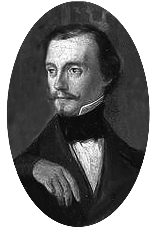
Мал. 2 Антоніо Марія Есківель. Портрет іспанського історика мистецтва Педро де Мадрасо (Madraza, 1872)

1992 року, присвяченій термінам археологічної кераміки, знаходимо поняття « ceramografia », яке означало « tratado sobre la historia de la ceramica. Estudio de la ceramica » (« трактат з історії кераміки. Вивчення кераміки ») (Martínez, 1992, р. 16). З утворенням 1989 року в Іспанії Асоціації керамологів на означення дослідників і наукової дисципліни про кераміку застосовували терміни « ceramologo » й « ceramologia ». Власне, таке об'єднання всієї сукупності знань про глиняні