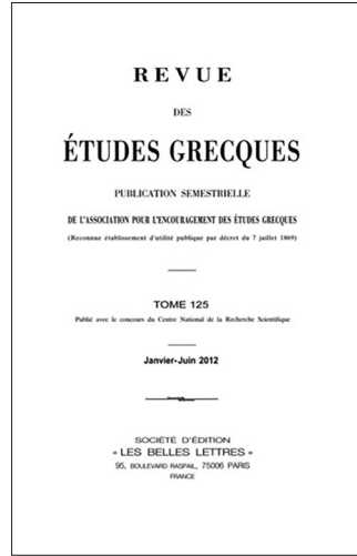
Мал. 6 Обкладинка журналу « Revue des Études Grecques ». Париж, Франція. 2012 (Persée, 2005–2018)

утвердження «нового синтезуючого напрямлення – керамической экологии» (1996, с. 7). Лише деякі російські вчені використовують терміни «керамологія» або «археологическая керамологія» (Коваль, 2009а, с. 137-141; 2009б, с. 142-152; Черкасов, 2004, с. 9).