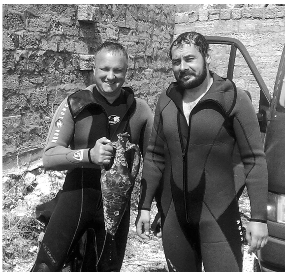
Мал. 5 Учасники експедиції зі знайденою римською амфорою. Карантинна бухта. 2009